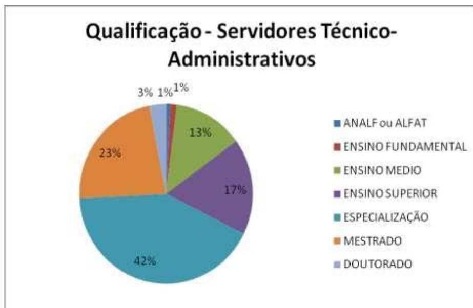
Gráfico 1: Qualificação dos técnicos administrativos em janeiro de 2020

Como dito na apresentação deste documento, o aumento da titulação vem sendo perseguido pela Ufes ano a ano, e por isso seus servidores estão qualificados ou em processo de qualificação, o que visa atender com mais efetividade as demandas dos usuários. Os gráficos abaixo demonstram que, mesmo com o apoio da Universidade, ainda há servidores e principalmente docentes que precisam se qualificar.